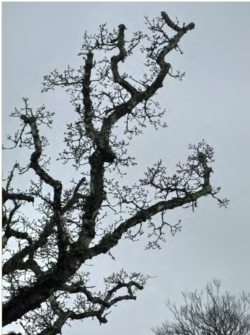
Dépérissant, pas sénéscent.