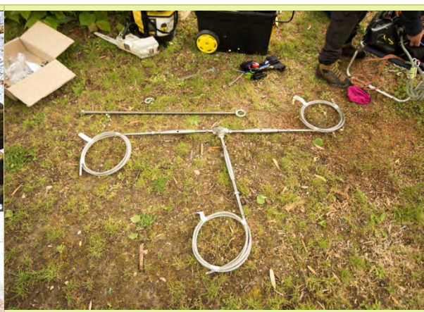
Système semi statique.