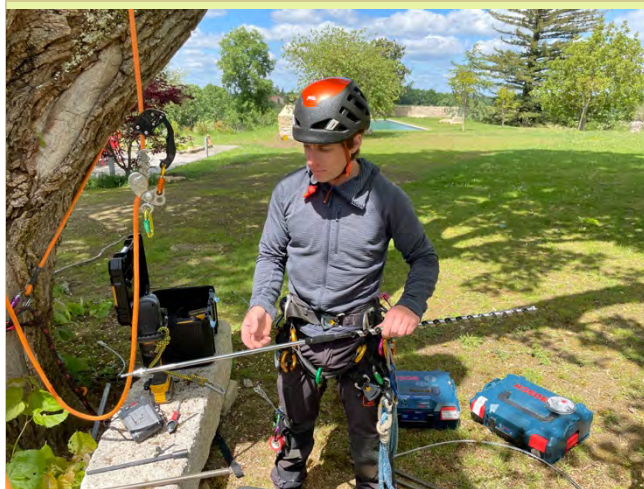
Des outils modernes et adaptés.