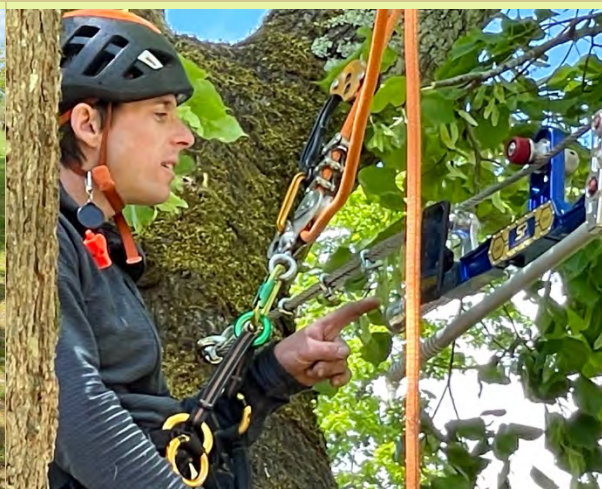
Suivie de la tension d'un système de haubanage.