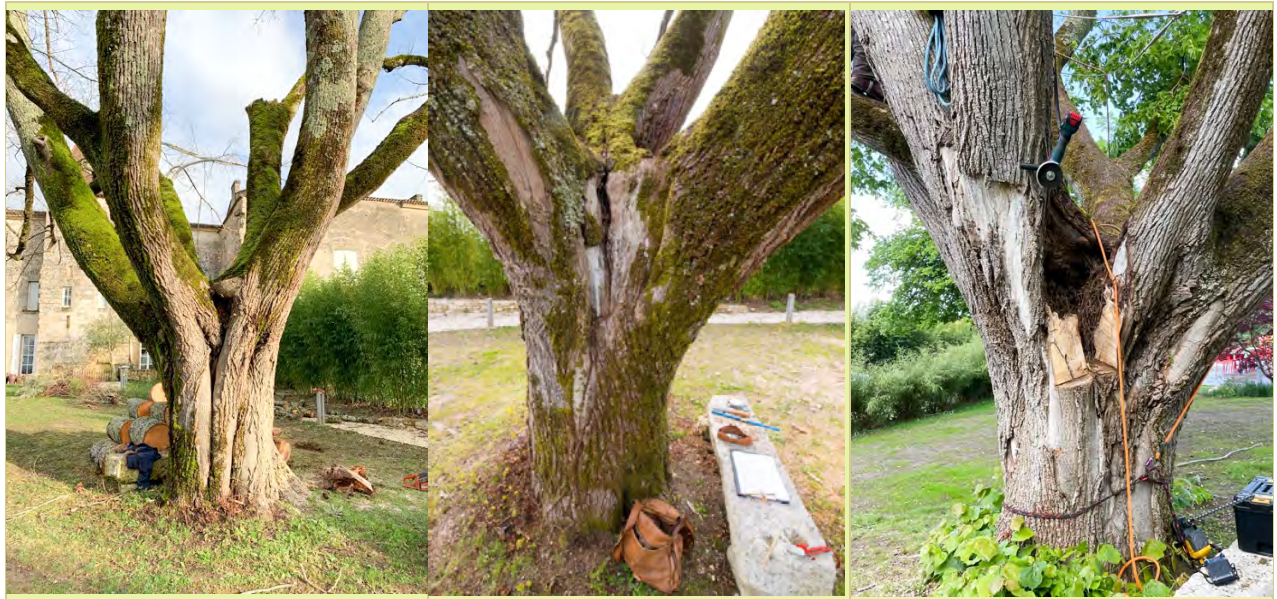
Tilleul à défauts complexes.