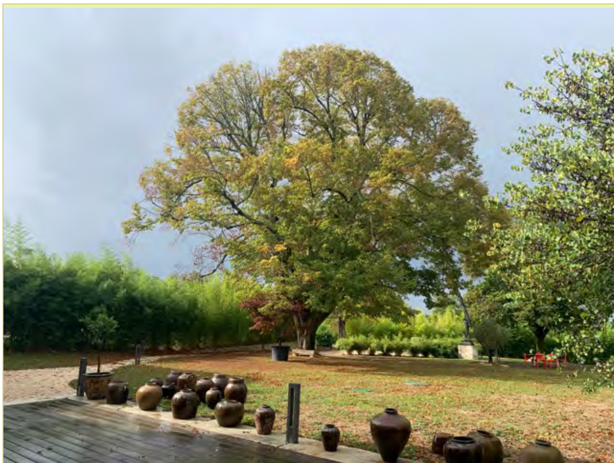
Tilleul de grande valeur à défauts mécaniques complexes.